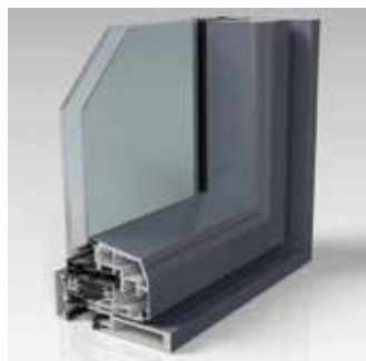
Design con anta smussata