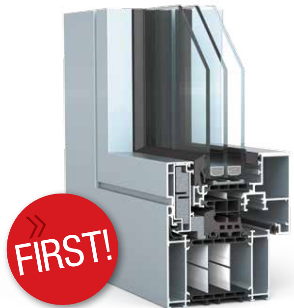
ETC Intelligence® - en innovation från WICONA

Detta innebär stora besparingar i form av reducerade lagerkostnader samt snabbare och enklare montage.