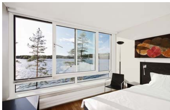
Fenstersystem WICLINE PSK (Parallel-Schiebe-Kipp-Fenster)

Ausführliche Produktinformation über WICLINE 77HI plus und alle weiteren WICONA Systeme für Fenster, Fassaden, Schiebeelemente und Türen finden Sie unter www.wicona.de .