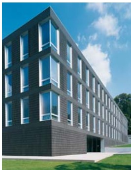
Accademia die Archittettura, Menrisio

Die WICLINE 77 Serie ist die ideale Lösung für Bauvorhaben, die hohe Ansprüche an Wärmedämmung, Flexibilität und Optik stellen. Ob Neubau oder Sanierung, Einsatz als Lochfenster, Fensterband oder in Glasfassaden: WICLINE 77 bringt die unterschiedlichen technischen und gestalterischen Anforderungen immer leicht in Einklang. Mit WICLINE 77HI plus (Hochwärmedämmung optimiert) mit U_f -Werten bis 1,0 \text{ W}/(\text{m}^2\text{K}) steht Ihnen ein technisch ausgereiftes System zur Verfügung, mit dem Sie den für Ihr Bauvorhaben erforderlichen U_W -Wert durch Anpassung der Systemkomponenten erreichen können.