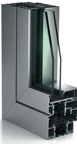
WICLINE 77 Lochfenster/ Fensterband