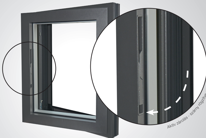
Rejtett kilinccses működtetés Kizárólag a WICONA rendszerben érhető el!

Ablakkilinccsel működtetett nyitáshatároló. Egy mozdulattal biztosítható a friss levegő áramlása, még hozzá úgy, hogy nem áll fenn a veszélye annak, hogy a „huzat” becsapja az ablakot.